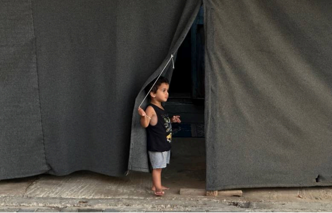
طفل نازح يقف خارج خيمة مؤقتة في دير البلح، المنطقة الوسطى، قطاع غزة.